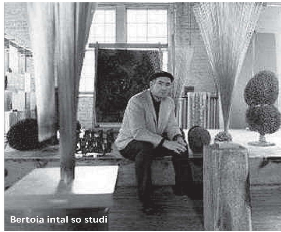
Bertoia intal so studi

Tal Dizionario biografico friulano ( www.friul.net/dizionario_biografico.php ) al è. Ma trops sono i furlans che a cognossin Harry Bertoia? E trops sano che, in plui di jessi stât oresin e scultôr, al è un di chei "designer" che a an lassade la ferade e che a an vût une innomine mondiâl? E cui saial che, cuant che al è partît cun so pari pes Americhis, che al jere un canai di 15 agns, si clamave Arieto e che al è diventât Harry tai Stât Unîts? Mancul mâl che i Museus civics di Pordenon a an decidût di scancelâ une dismentie imperdonabile e di tornâ a puartâ cjase sô un artist dai plui grancj che il Friûl al vedi vût di simpri incâ.